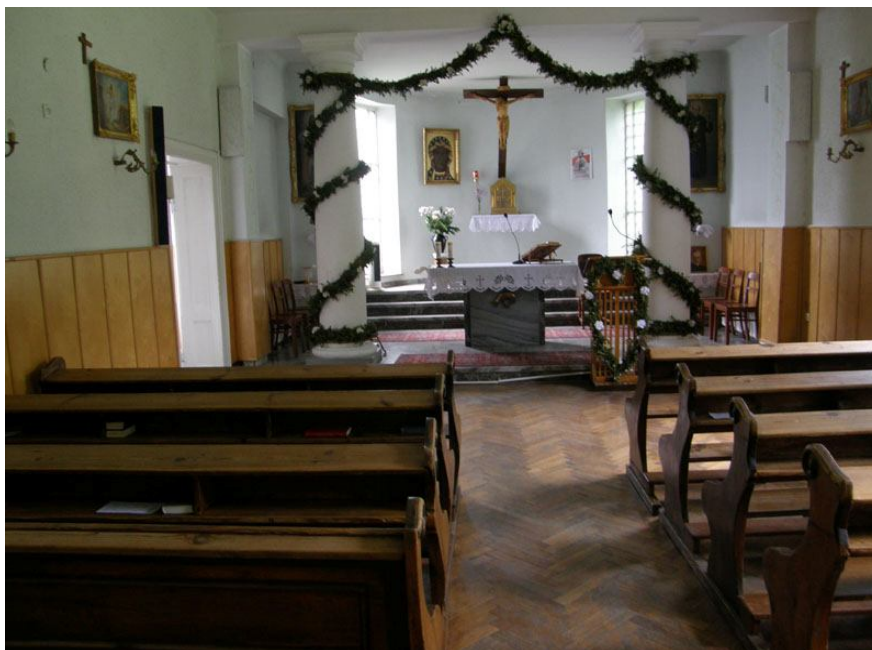
Kaplica w klasztorze pallotynów w Sucharach.

Kaplica w klasztorze do dzisiejszego dnia służy okolicznym mieszkańcom. Od kilku lat trwają remonty i przystosowywanie placówki na Dom Rekolekcyjny.