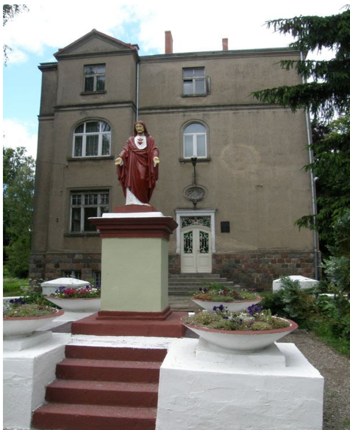
Klasztor księży pallotynów w Sucharach.

W 1921 r. pallotyni nabyli dom w Sucharach, który służył różnym celom polskiej prowincji pallotynów. Było tu między innymi gimnazjum i dom rekolekcyjny.