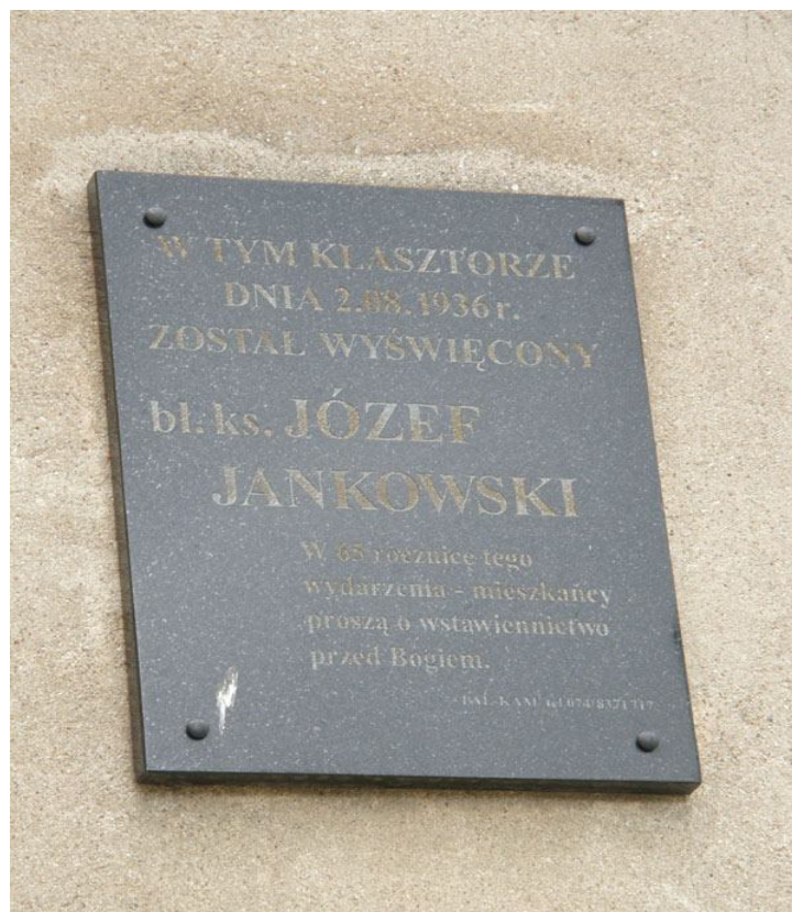
Tablica pamiątkowa znajdująca się przy drzwiach wejściowych do klasztoru.

"Prośmy Boga, by nauczył nas cierpieć i innych uczyć cierpieć".